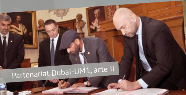
Partenariat Dubaï-UM1, acte II