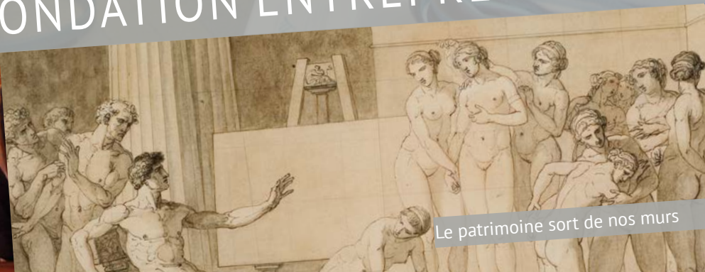
Le patrimoine sort de nos murs