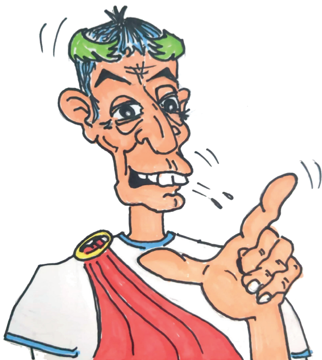
Dessin : Christian PICARD - libre de droit