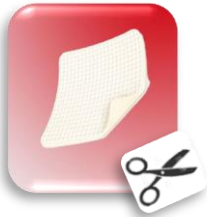
URGOSTART® hydrocellulaire 13x12cm / 752031