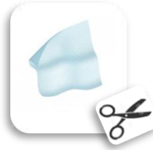
URGOSTART® interface 10X10cm / 752036