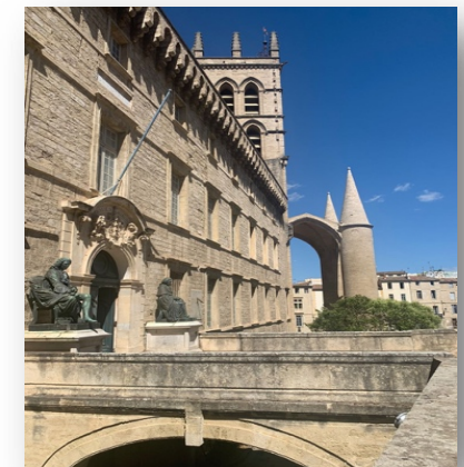
Faculté de Médecine – 2, rue de l'école de Médecine

Cette année, les journées de Lymphologie auront lieu dans l'enceinte de la célèbre faculté de médecine de Montpellier qui est la plus ancienne école de médecine en exercice continu du monde occidental. Elle a célébré en 2020 l'anniversaire des 800 ans de proclamation des statuts de l'université de médecine de Montpellier, créant par là même la médecine universitaire.