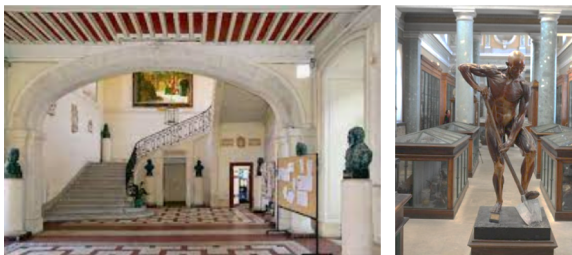
Hall d'entrée de la Fac de Médecine Musée d'Atger