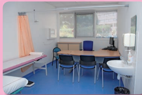
Salles de Consultations