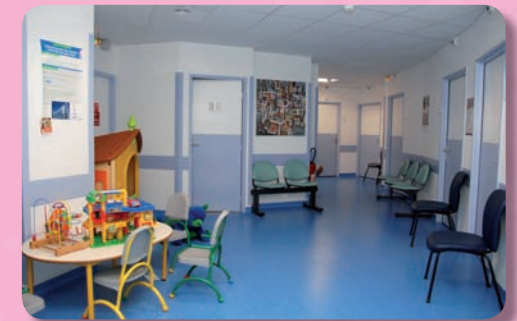
La Salle d'attente

A la réception des examens complémentaires, un nouveau courrier sera adressé et/ou une consultation de synthèse pourra vous être proposée.